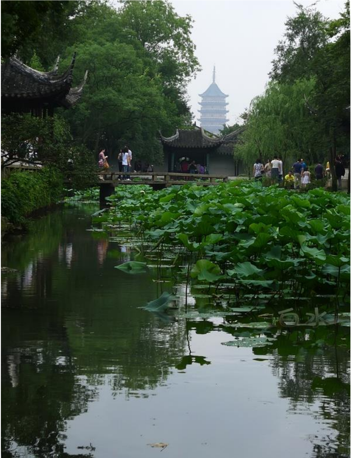
借景——寶塔為北寺塔，距離拙政園有不少距離，造園者巧妙地把該塔借到了園林景色中。